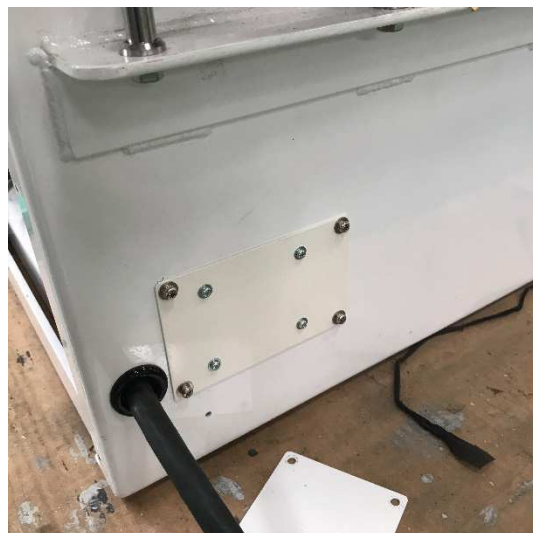
ユニット取付(外部)