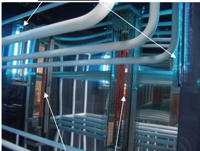
遠赤外線ヒーター