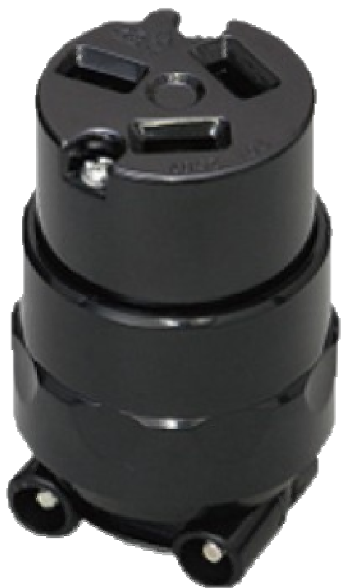
AF65/54TEN 三相 コネクター