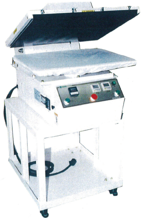
AF-65TEN型 + UR台車

縫製工場機械/コインランドリー機器/クリーニング機械 ゴルフ場・厚生施設・病院・ホテル等洗濯、乾燥、プレス設備